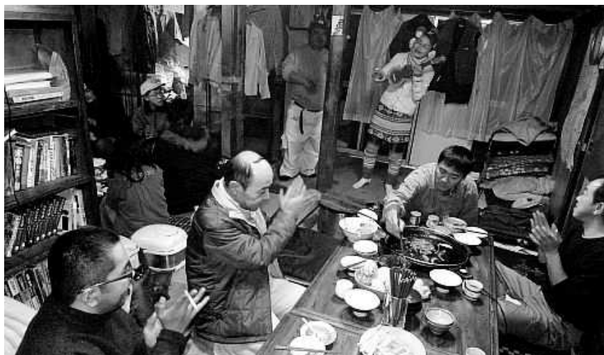
(写真・前回の助け合い鍋の様子)